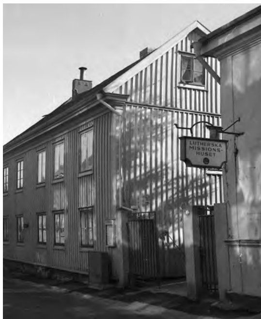
Gatuskylt som visar Lutherska Missionshuset på Stora Möllebacksgränd 7.

Rätt snart visade det sig att även detta hus var för litet och därför inköptes 1873 den intilliggande tomten och bostadsfastigheten. Invigningen blev den 21 november 1879. Ombyggnationen gick till 7,515:06 kronor.