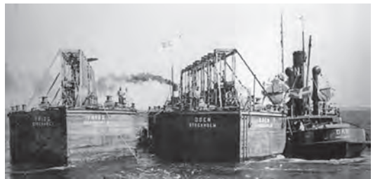
Den bärgade ubåten Ulven under inbogsring till Göteborg av bogserbåten Dan mellan de båda pontonerna Frigg och Oden 1943.

Då Ulven lokaliserats uppstod en diskussion huruvida hon skulle bärgas, eller som inte sällan är fallet till sjöss, låta fartyget vila på botten och lämnas som en orörd gravplats. Det fanns dock ett stort både be-