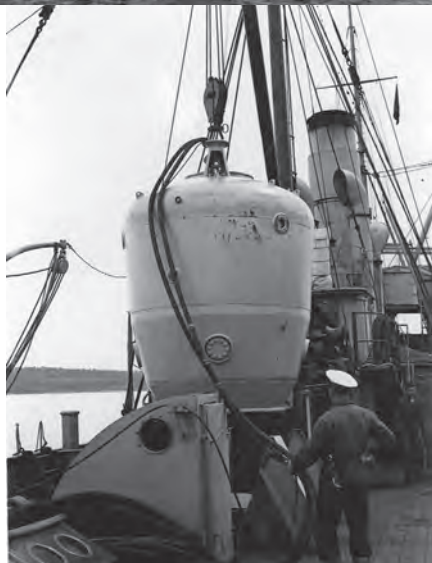
Överst: HMS Belos. Byggd 1885, bredd 7,96 m längd 44,73 m. Maskinstyrka 640 hkr. På akterdäck styrbords-sida syns dykarklockan som ses i närbild ovan.