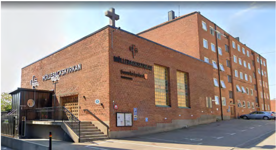
Möllebackskyrkan med intilliggande bostadshus. Foto: Google Street View, augusti 2022.

Lagom till jul – den 15 december 1960 kunde hyresgästerna flytta in i föreningens hyreshus. Den nya kyrkan invigdes på hösten 1961. Arkitekt var Stig Forsberg (1923–2010).