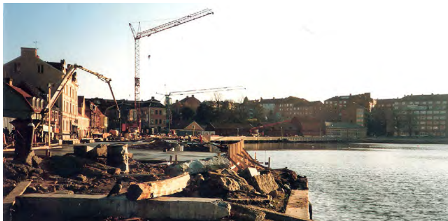
Arbeter pågår 1984 vid Borgmästarekajen.

Kajerna längs hamnen rasar vilket jag nämnt tidigare. Jag vill nu bara berätta att den beräknade kostnaden för en tillfällig plats för Aspöfärjan, och reparation av den gamla rampen, blir nästan fem miljoner. Den tillfälliga platsen blev intill nuvarande färjeläget och reparationsarbetet började 22/5. Det är ju inget nytt att havet ständigt angriper stadens kajer. Hur många gånger har inte Borgmästarekajen och Fisktorget fått pålas om?