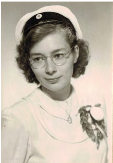
Till vänster: Studentfoto från 1950.