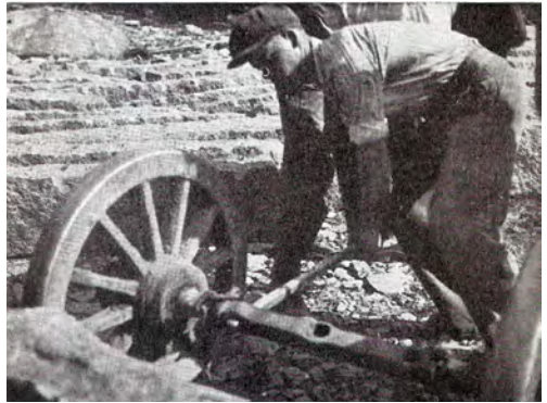
Till höger: Bakvagnen rullas åter fram till den lastade stonbjörnen. En kraftig kätting fästes vid vagnaxeln.

Wolff hade planerat ett litet lokomotiv för att dra barrarna men insåg snart att han kunde få kontrakt med fångvårdsstyrelsen, och använda sig av fångarna i Kronoarbetaškåren , som bekant fanns på Tjurkö. Det blev ett inslag i straffarbetet för fångarna att dra rallen. Kontraktet slöts 1872. Fånganstalten lades ner 1894.