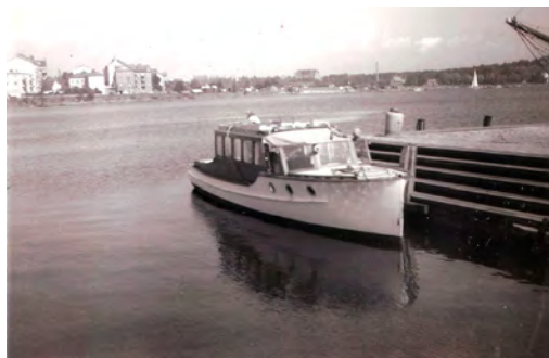
Bild av skärgårdsbåten ”Viking” vid Tallebryggan. Kortet är från 1940-talet. Bryggans namn kommer av att färjan till ”Tallet” eller ”Skogsparken” på Vämö angjorde här. I bakgrunden, till vänster i bilden, skymtar Pantarholmen.

I lokalpressen förekommer skrivelser om att stadens tillfart, än en gång, skall byggas om. In- respektive utfart har sedan stadens grundande 1680 varit det stora problemet, men det unika läget på skärgårdens öar, är också stadens största tillgång. Infartsleden skall omgestaltas till stadsgata med trädalléer. Eftersom påldäcket, under Österleden, redan uppnått sin tekniska livslängd skall det tas bort. Vattenytan i den delen av hamnen, där ” Tallebryggan ” en gång låg, blir något större (se bildskissen på nästa sida). Havet står därmed, i första rondon mot staden, som en återerövrare! Byggstarten är planerad till 2024.