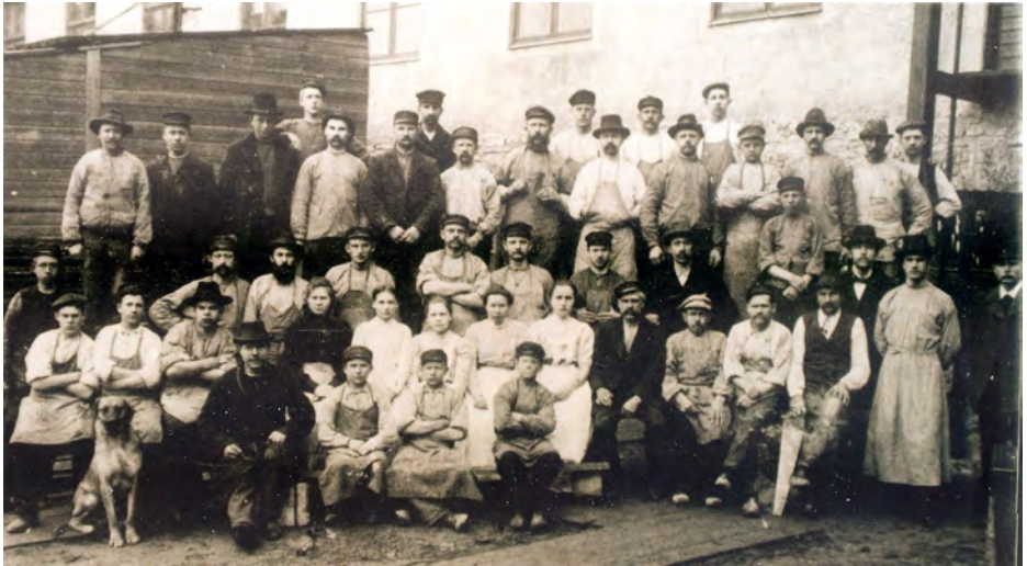
Arbetsstyrkan på Kakelfabriken i början av förra seklet.