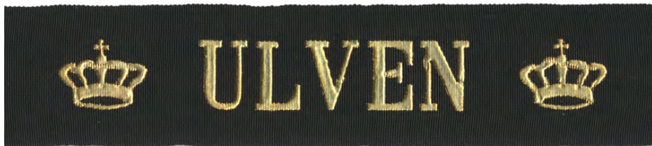
Ovan: Mössband från Ulven