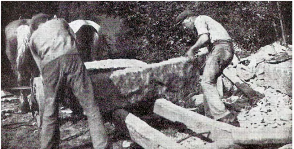
Ovan: De utkilade stenblocken lastas på stenbjörnen.