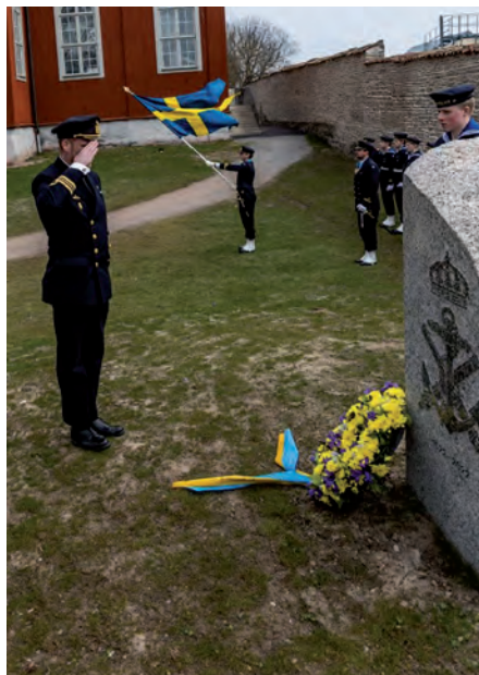
Minnesceremoni för HMUb Ulven i Karlskrona vid Marinens 500-årsjubileumssten i anslutningen till Karlskrona Amiralitetsförsamlings Minnes- och meditationsplats Skeppet.