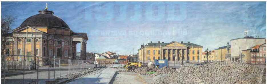
Pressbild 7 mars 2023 Stortorget's förändring pågår.

I Karlskrona stensattes förr med kullerstenen, ”pepparnötterna” eller ”kattskallarna” som hämtades ur istidens kvarlämnade rullstensåsar.