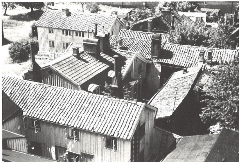
Husen Teatergatan 6-14 sedda från höghuset

Detta är berättelsen om en gata, som inte längre finns. Om dess gårdar och hus, som raserats av grävskoporna. Men också om dess människor, av vilka jag var en. Jag kommer ofrivilligt att tänka på sången om "Lyckliga gatan", som med sin vemodiga melodi förtäljer: "Lyckliga gatan, du finns inte mer, du har försvunnit med dina kvarter". Och så vidare: att barnen är borta och skratten har tystnat, och att mäktiga betongkomplex nu reser sina fasader mot skyn mellan asfalterade gator.