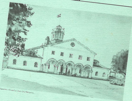
Högvakten. Akvarell av Sven Olof Bergström.