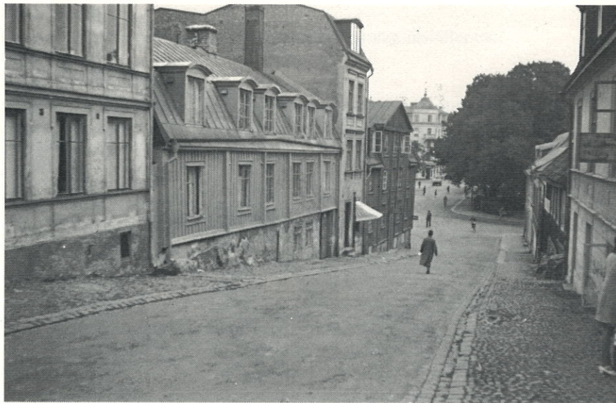
V. Vittusgatan backen mot Hoglands park.