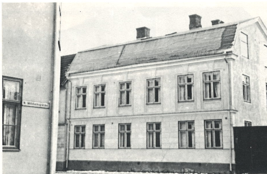
Nr: 13, kv Reval