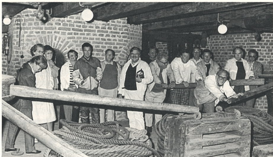
Styrelsen gör besök i Gamla mastkranen.