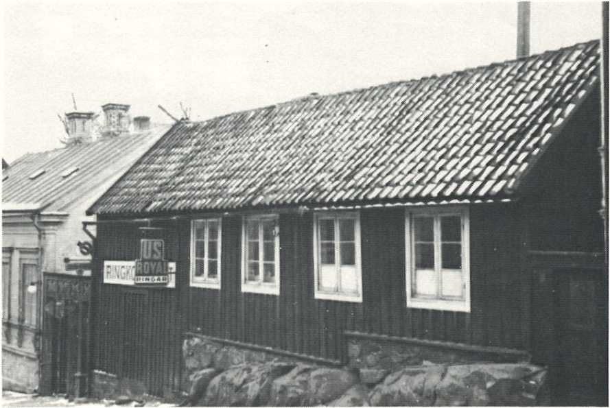
V. Vittusgatan nr 3.