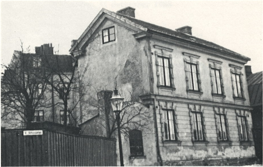
Nr: 15, kv Reval

Nummer 6. Denna tomt verkar ej så stor sedd från gatan, men är den stor och lång åt gårdsidan. Huset åt gatan var av trä med en trappa till entrén, vilken senare borttogs då huset reveterades. Ägare var på sin tid polis Hillerström, som restaurerade byggnaden. För övrigt står denna fastighet oförändrad med bostadshus även nere på gården.