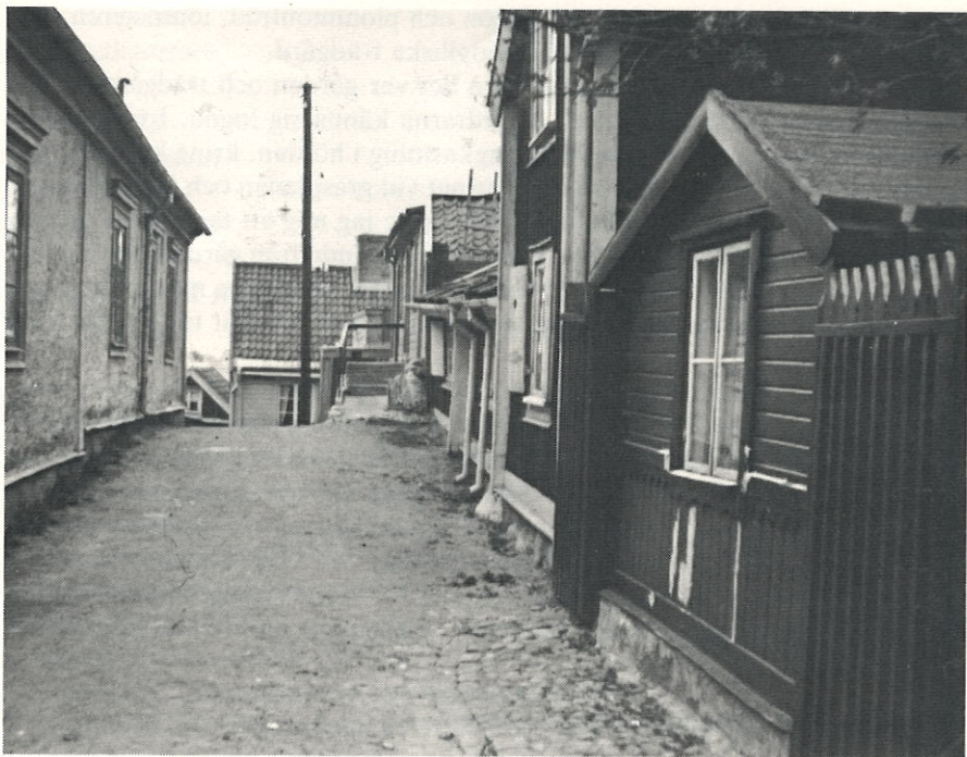
Nr 18, 20 och 22 fr. höger. kv Cronhaven.