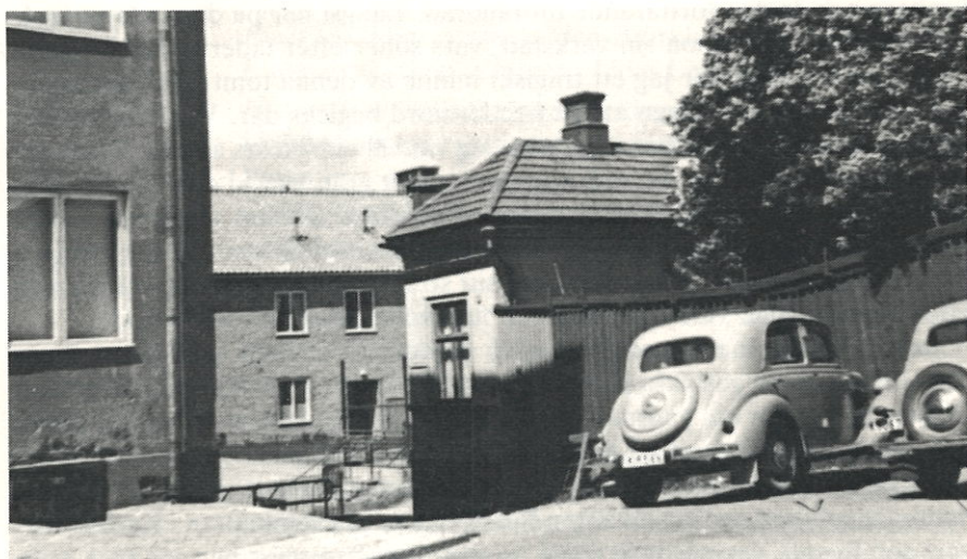
Gaveln av huset västra sidan av kv Cronhaven.