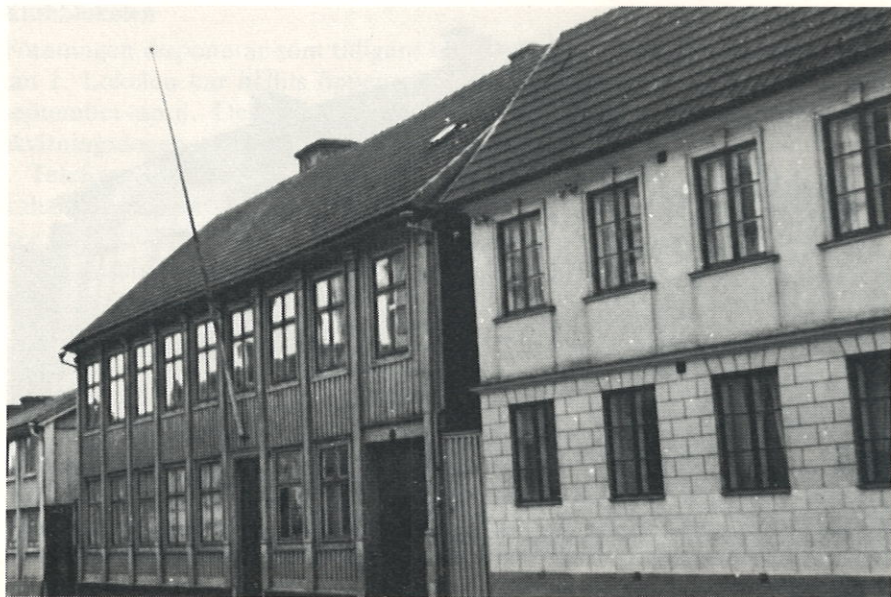
Nr: 7, 9, och 11, kv Reval

set var av trä i två våningar. På nedre våningen bodde vi. När sjön gick hit upp minns jag ej, men mina äldre syskon har berättat därom. Däremot kom jag ihåg viken hade blivit fylld och blev varnad för att ej beträda den lösa fyllnaden.