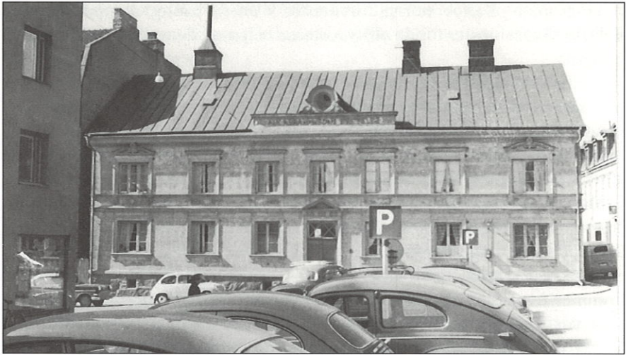
Abramsonska stiftelsens hus.

Nu har vi kommit fram till Bagaregatan. Det är bara en liten tvärgata utan större intresse, möjligen med undantag av den cementslagna gården som bland annat inrymde bageri. Snett över, i hörnet av Östergatan, låg en liten låg stuga som skulle varit intressant om den bevarats.