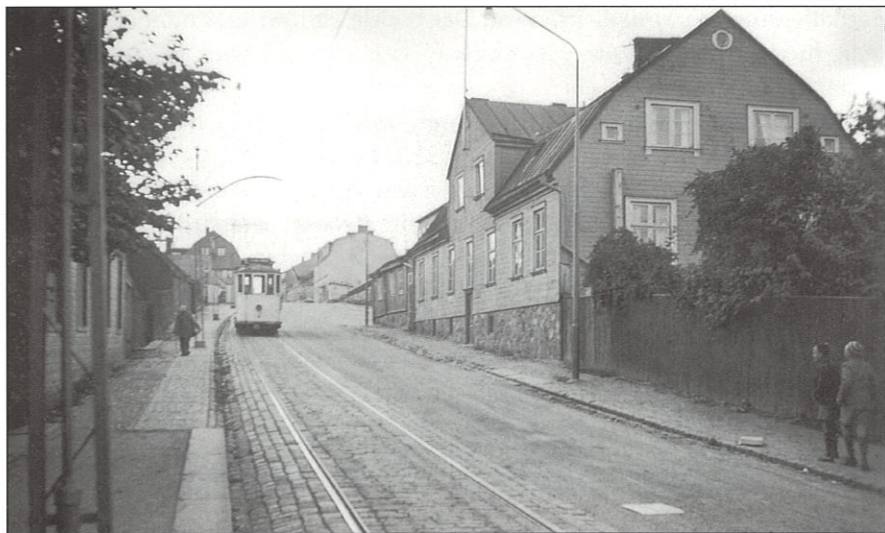
Spårvagnen vid gamla polisvakten.

kallad "låudan", skramlande tager sig ner för backen. Hur den passerar stiftelsen Hemmet och gamla polisvakten som numera genom kommunens försorg blivit bostäder för några familjer. Vi ser hur spårvagnen svänger vid "Epidemin" och vet att den måste göra en sväng till innan den kommer fram till mötesplatsen vid Kakelfabriken. Så snart skall en annan spårvagn taga sig upp för Landsvägsgatebacken.