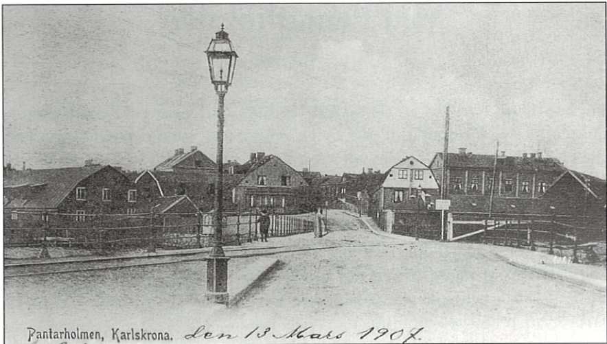
Pantarholmen, Karlskrona. Den 13 Mars 1907.

Landbron. låg som sedan övertogs av "Skrotjohan" innan höghuset byggdes. För troligen var Pantarholmen skilt från Vämön av vatten, innan det fylldes ut med det muddar, som skulle bli Tullparken, och innan dess benämndes Muddret. Efter det här som kan tyckas vara onödigt prat kan vi börja vår vandring på Pantarholmen som det såg ut på tjugo- och trettio-talen.