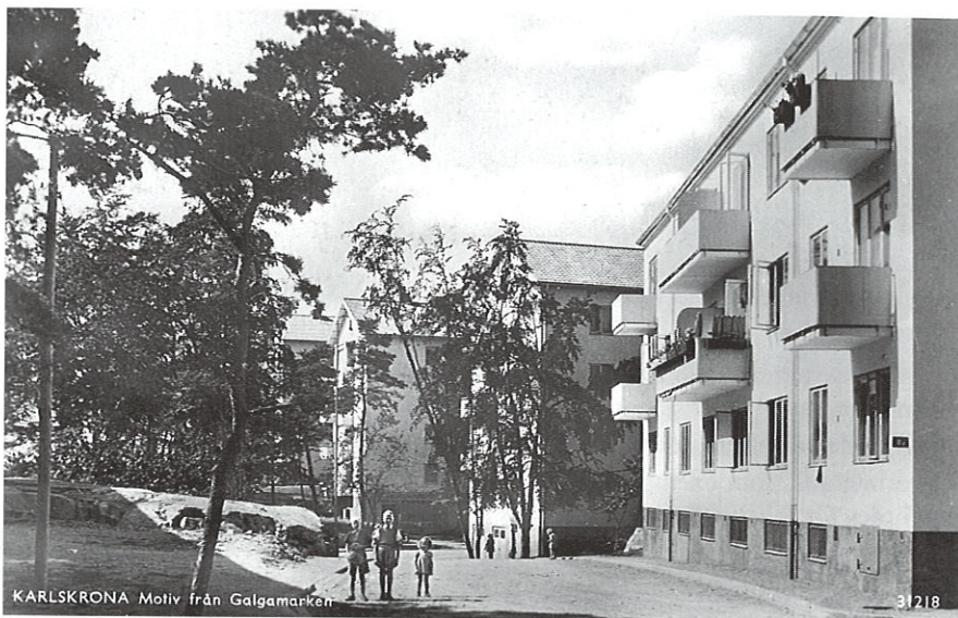
Snapphanevägen, i andra huset med garage, bodde författaren

Länstidningen skriver också vid denna tid ”Många trodde säkert när man plane- rade bebyggelse i Galgamarksområdet att detta endast skulle förbli en framtida önskedröm” – Om man nu tar en promenad genom området, vilket rekommenderas alla som är intresserade av vår stads utveckling, så finner man en kraftig och vacker bebyggelse där. Som flera gånger framhållits har det nya området planlagts på ett utmärkt sätt och man har försökt låta naturen vara orörd i så stor utsträckning detta- varit möjligt” Vidare skriver man att ”De som komma att bo i Galgamarken ska få det bra och bekvämt på alla sätt”