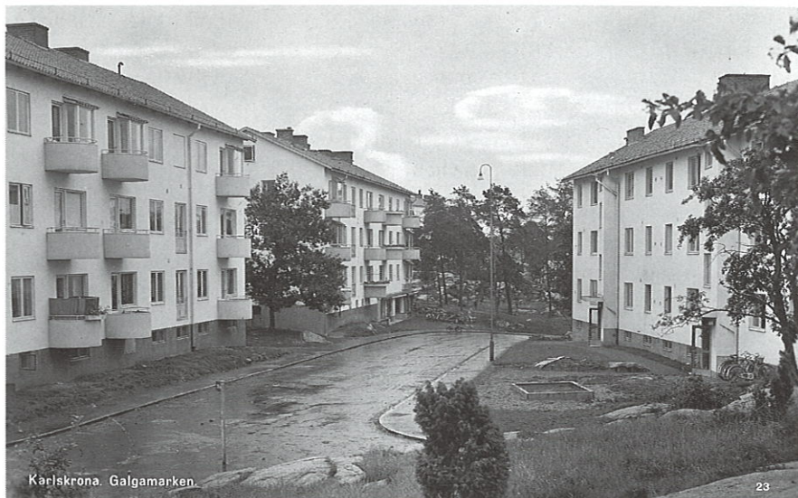
Vy från Domarevägen