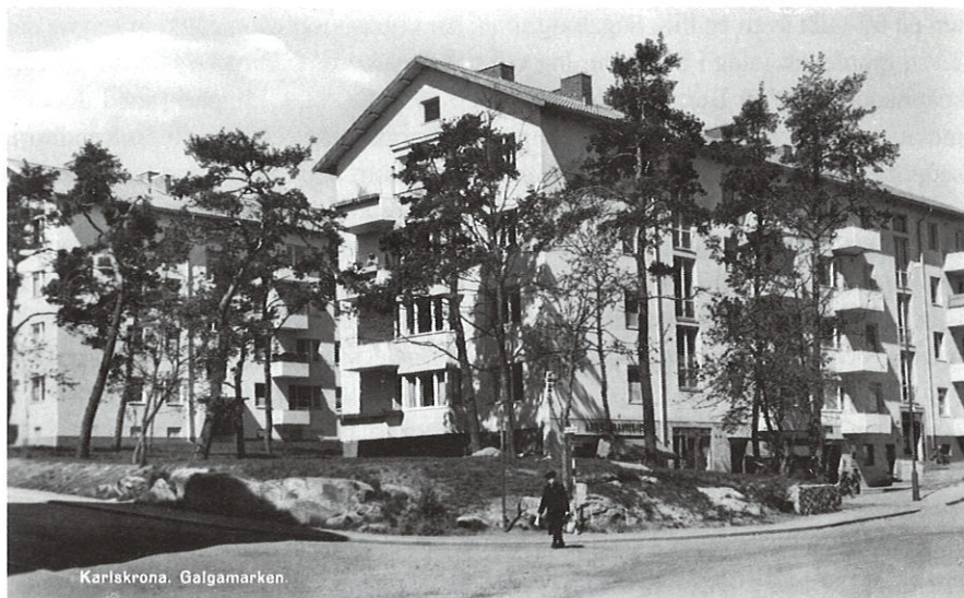
Utridarevägen 3 med flera butiker i bottenplanet

11 och då var det oftast långa köer av inte minst ungar. Efter klockan 11 på söndagarna, när högmässan pågick i våra kyrkor fick inte affärerna hålla öppet, då skulle "vilodagen" respekteras. De flesta arbetarefamiljerna var vid denna tid trogna medlemmar i den kooperativa rörelsen – Konsum, men alla butikerna verkade leva gott på sina fasta kundkretsar. Dessutom fanns det vid denna tid två specialbutiker för tidningar och tobaksvaror, "Lill-Tures" längst ner på Utridarevägen och Etcéns på Domarevägen, och därutöver kiosken som låg nedanför Galgamarkstrappan intill Sunnavägen, och som också hade en stor sortering med godis och som jag kommer ihåg det, sannolikt Karlskronas största och godaste kokosbollar. På Gyllenstiernas väg hade Håkanssons en filialbutik, som vi kallade "kemikalieaffären" som även sålde kosmetika och parfym till damerna. På Domarevägen fanns en damfrisering och i änden på Utridarevägen Bergdahls "Blomsterboden" och en fiskaffär. Även om det var först några år senare som stora varuhus och köpcentra skulle ta över det mesta av marknaden, så kan man ändå förvåna sig över hur alla butikerna kunde klara sig, men det gjorde dom.