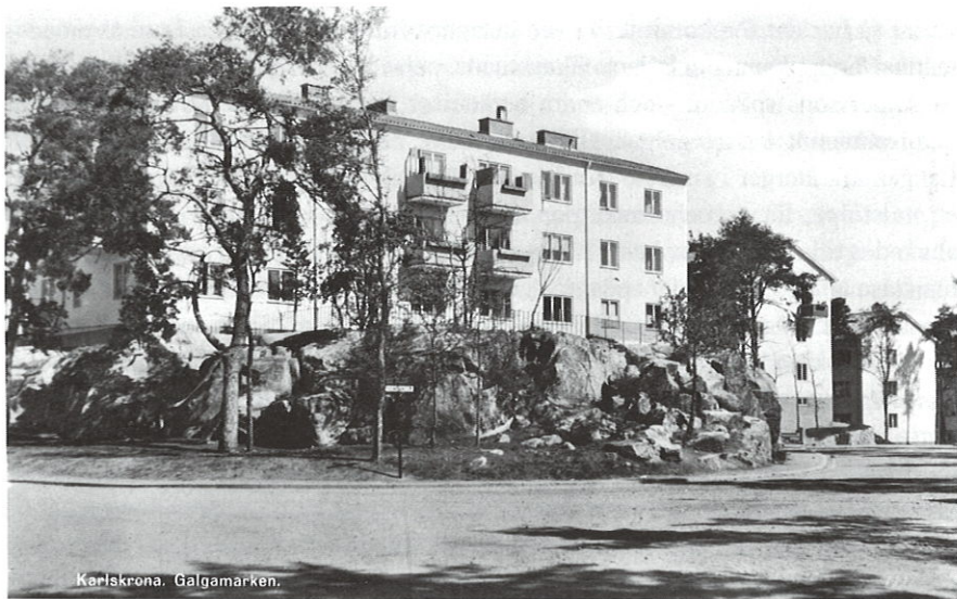
Korsningen Gyllenstjärnas väg och Utridarevägen

I den bostadssociala utredningen som genomfördes i mitten av 1930-talet konstaterades att Karlskrona hade den, bland 14 undersökta städer, största förekomsten av dåliga, och minsta andelen av goda bostäder. Något måste således göras för att komma till rätta med bostadsnöden och de sanitära missförhållandena, och stadsfullmäktige tillsatte därför en "sanerings- och bostadskommitté" för att utreda frå-