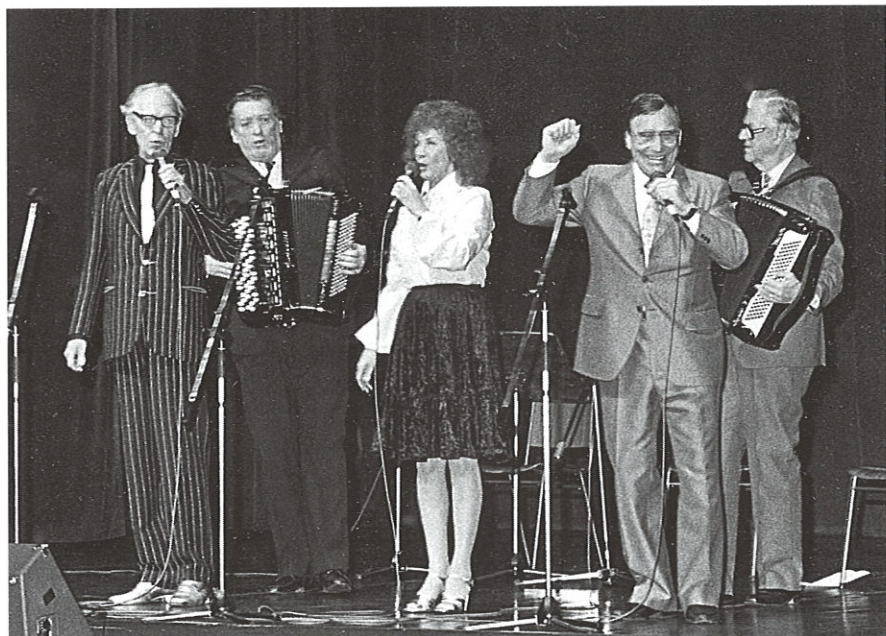
Harry Brandelius, Jojjo Johansson, Thory Bernhards, Bertil Boo och Ebbe Jularbo framträder på konserthuset som "Gamla skivbekanta".