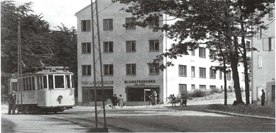
Utridarevägen med Bergdahls blomsterbod samt fiskaffär möter här Valhallavägen och spårvagn 5. (vykortet i detta nr av Kaulskroniten och är utlånade av Göran Mårtensson)